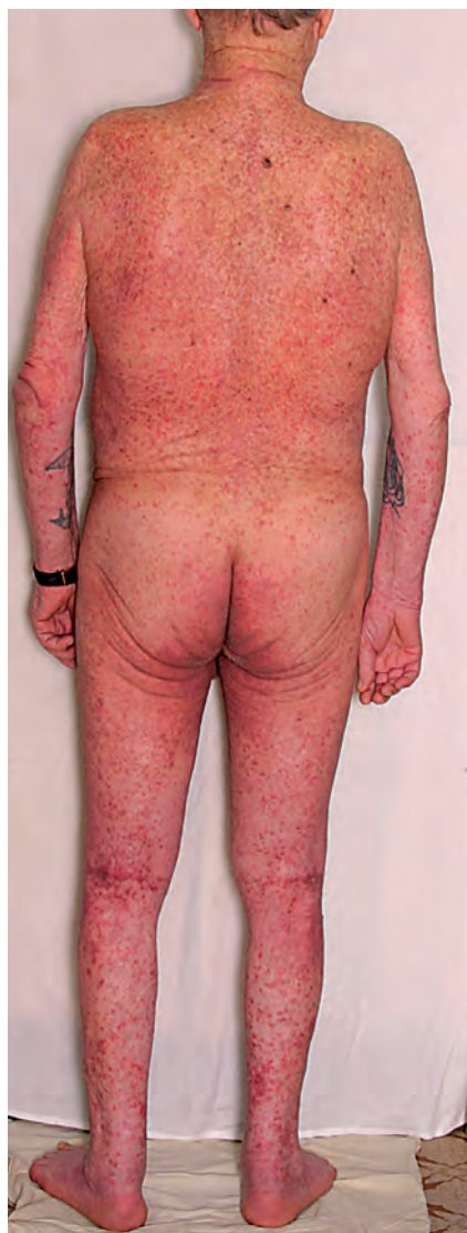
Рис. 8. Распространенная лекарственная токсикодермия