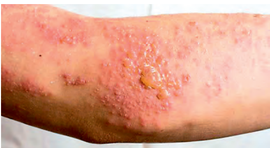
Рис. 2. Аллергический дерматит