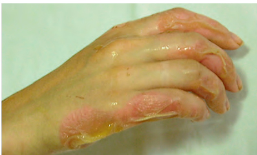
Рис. 4. Вскрытие пузырей (та же больная)