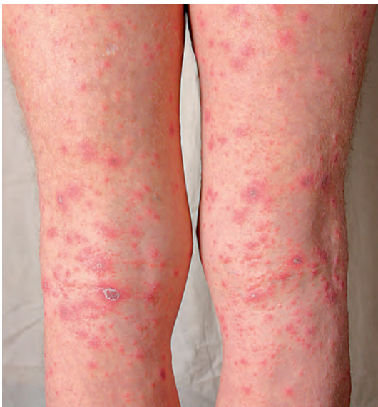
Рис. 11. Лекарственная токсикодермия (тот же пациент)