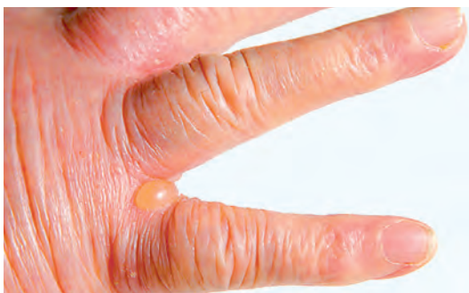
Рис. 1. Пузырь у больного с аллергическим дерматитом