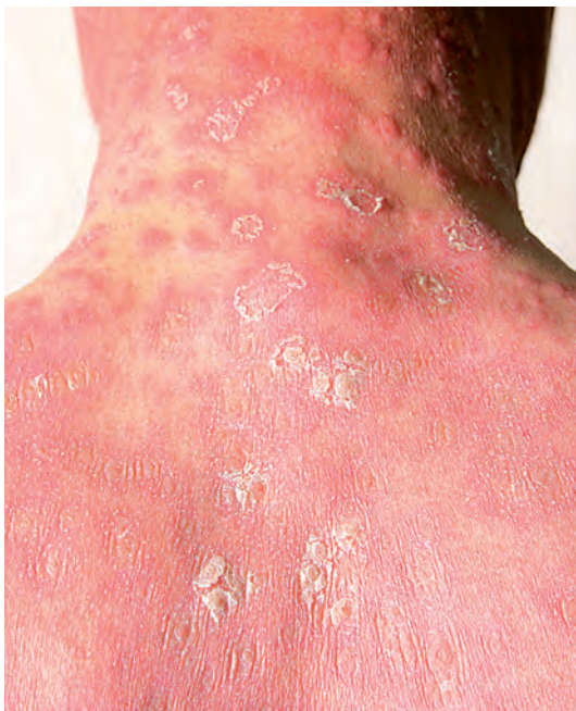
Рис. 10. Лекарственная токсикодермия