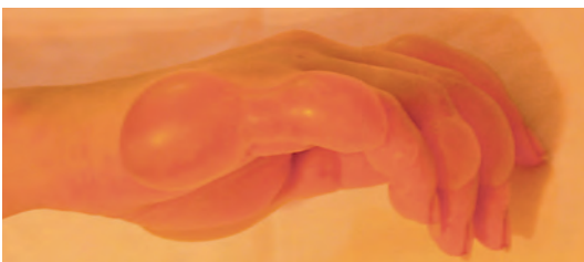
Рис. 3. Простой буллезный дерматит (реакция на борщевик)