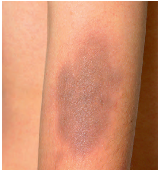
Рис. 13. Фиксированная токсикодермия (гиперпигментация). Локализация на предплечье