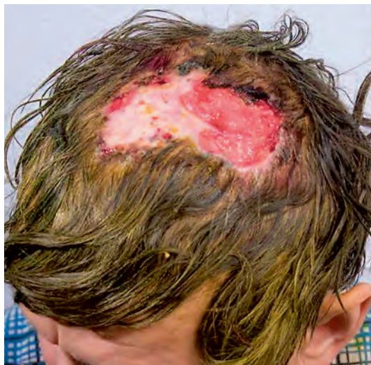
Рис. 5. Простой контактный дерматит (термический). Локализация на волосистой части головы