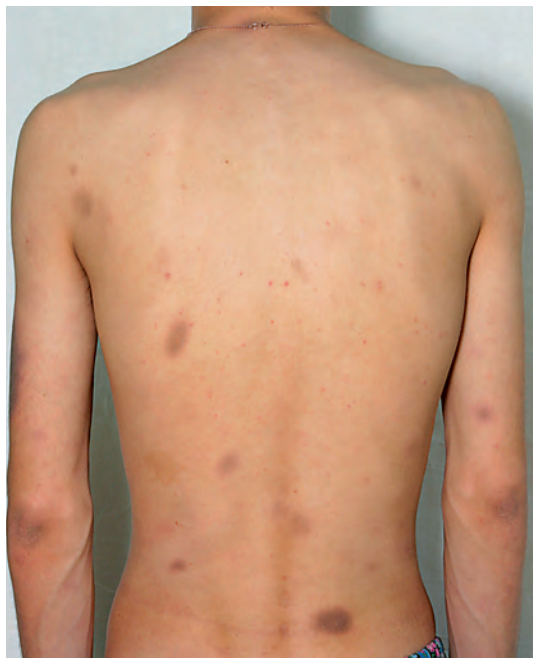
Рис. 12. Фиксированная токсикодермия (гиперпигментация)