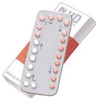
Циклічна гормональна терапія