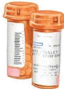
Агоністи гонадотропін-релізінг гормону