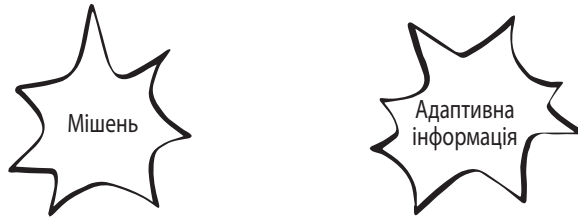
Мал. 5.1. Розділені мережі зі спогадом-мішенню та адаптивною інформацією

Потім психотерапевт вказує на схемі, подібній до мал. 5.2, як зв'язуються дві мережі.