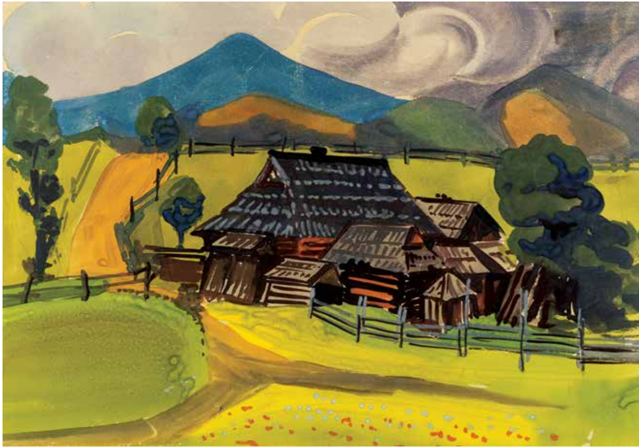
Будинок Палагни, серія «Карпати», 1965 р. Папір, акварель. 37×47 | 18 Palagna's house. "Carpathians" series, 1965. Paper, watercolor