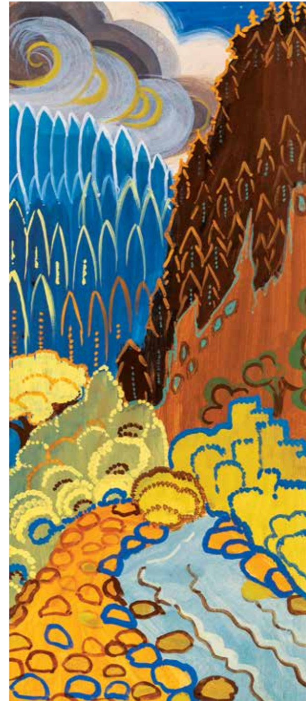
19 | Серія «Карпати», 1965 р. Папір, гуаш. 41×17,5 "Carpathians" series, 1965. Paper, gouache