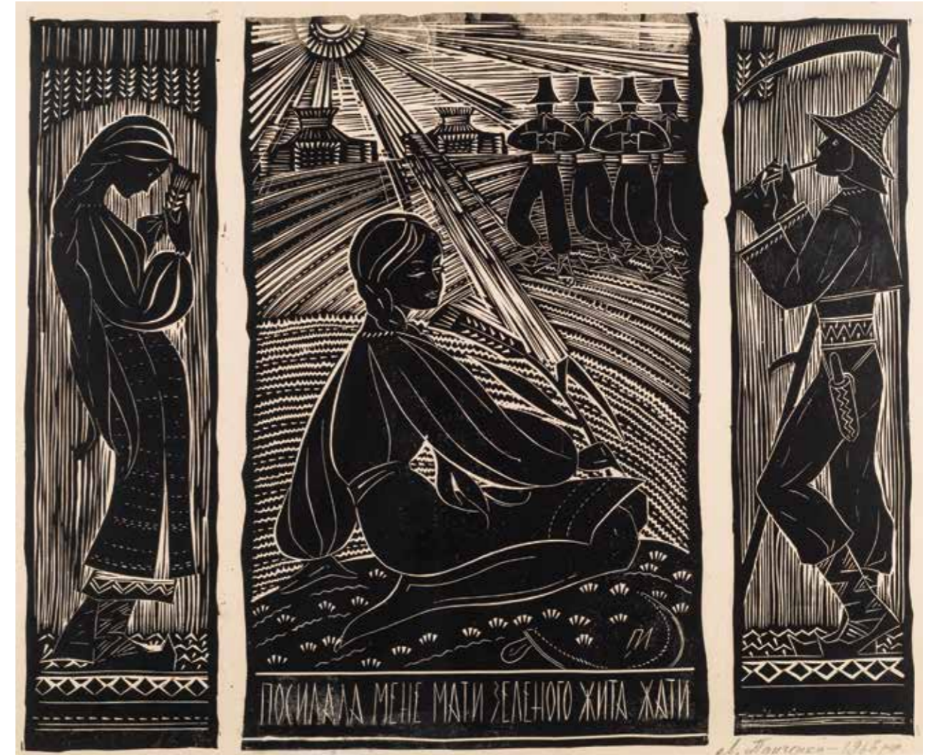
12 | Посилала мене мати зеленого жита жати, 1965 р. Папір, лінорит. 41×50,5 My mother sent me to harvest green rye (folk song), 1965. Paper, linocut