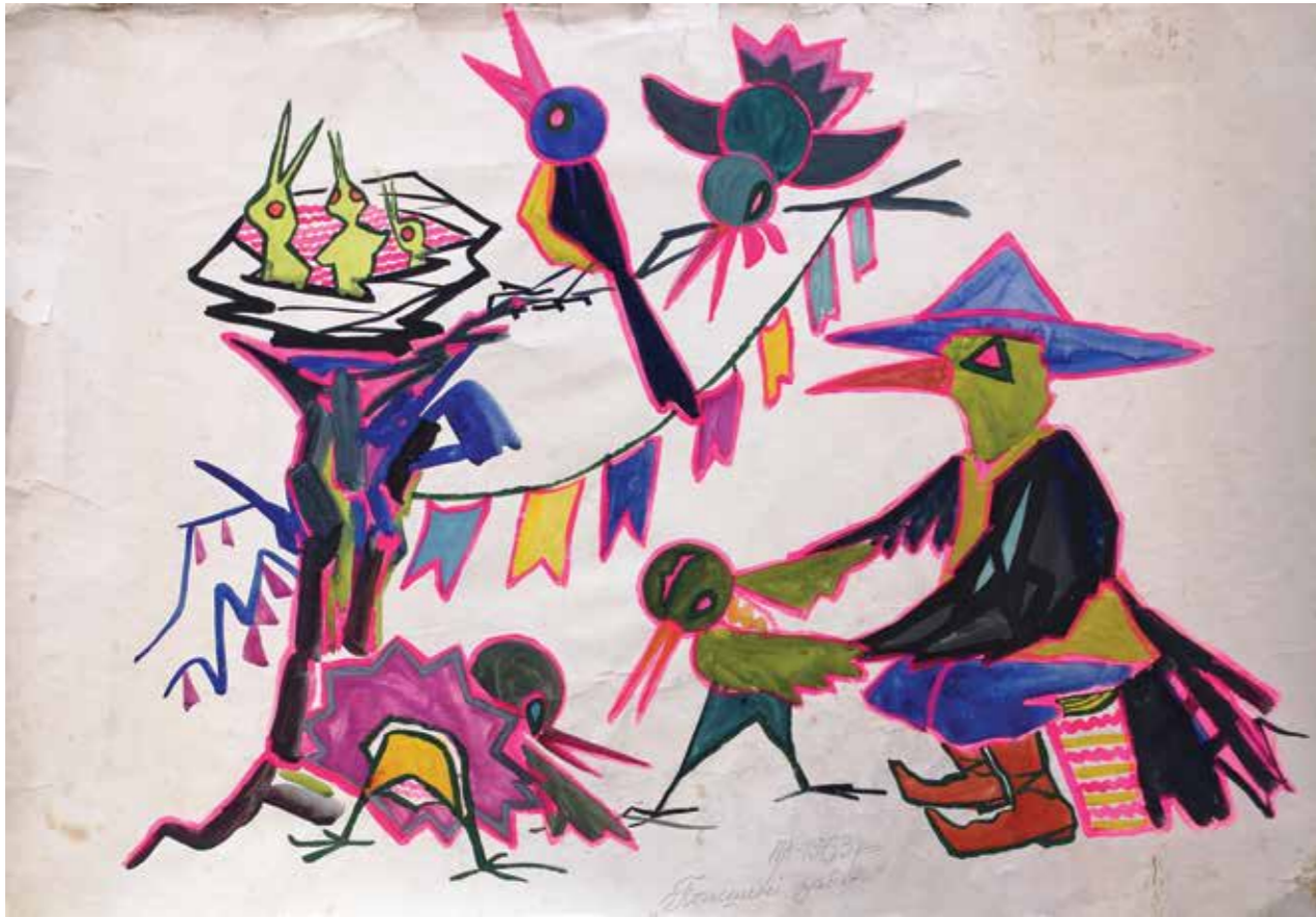
Пташині забави. Декоративний розпис, 1963 р. Папір, акварель. 60×84 | 148 Bird fun. Decorative painting, 1963. Paper, watercolor