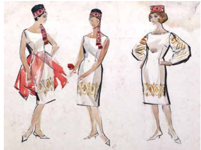
215 | Ескіз сучасного жіночого вбрання з елементами національного декору, 1960-ті рр. Sketch of modern female outfits with elements of national decor, 1960s