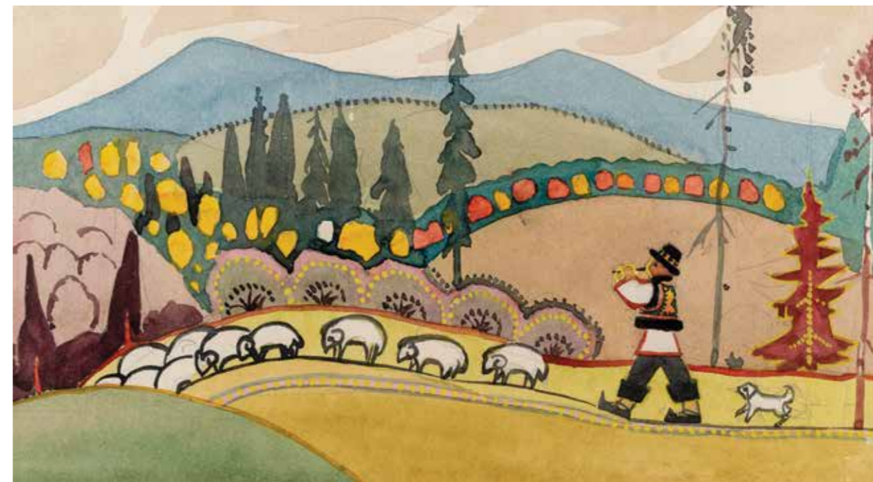
16 | Вівчарик, серія «Карпати», 1965 р. Папір, акварель. 14×30 Shepherd, "Carpathians" series, 1965. Paper, watercolor