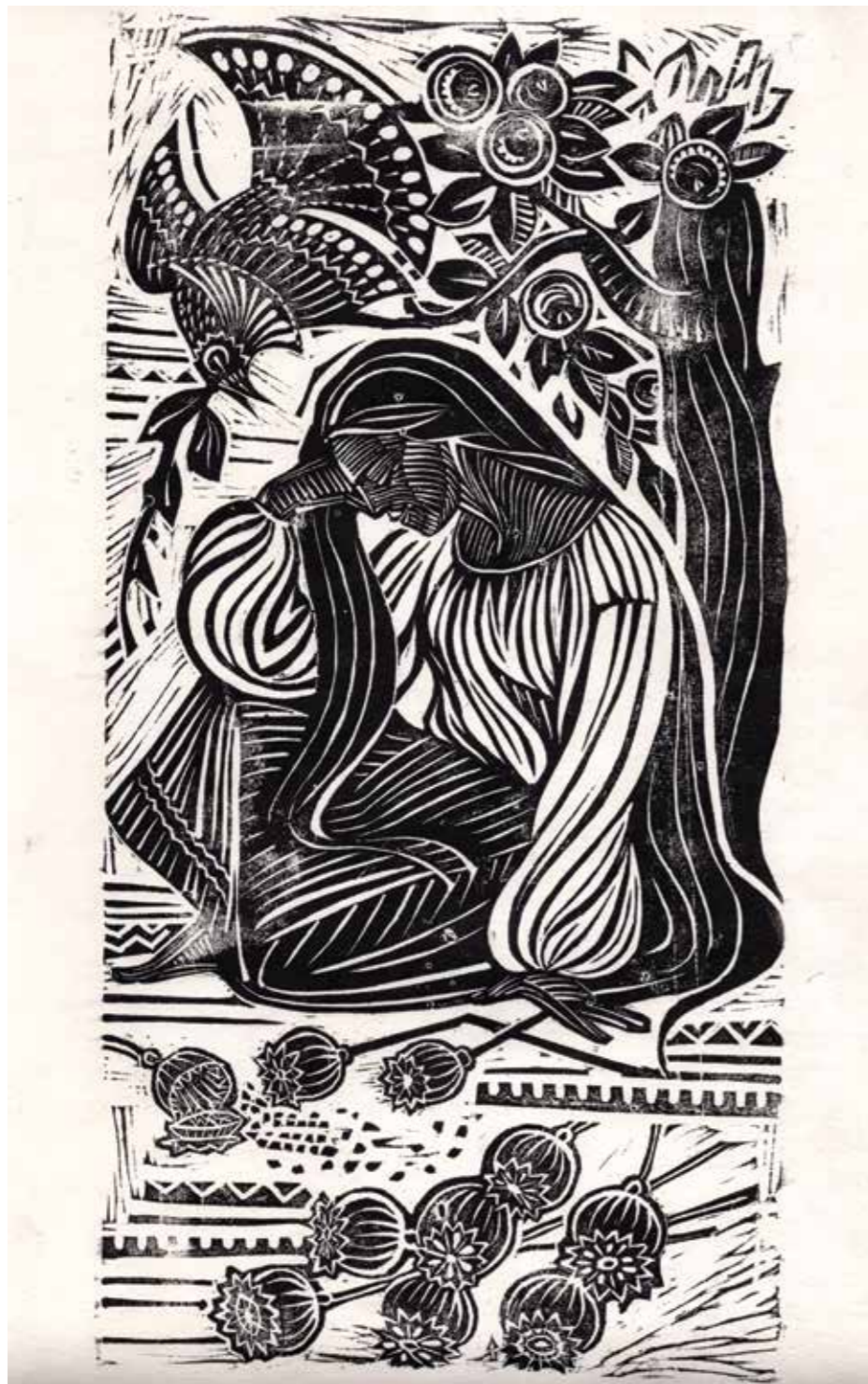
Горпина, 1965 р. Папір, лінорит. 63×35 Horpuna, 1965. Paper, linocut | 13