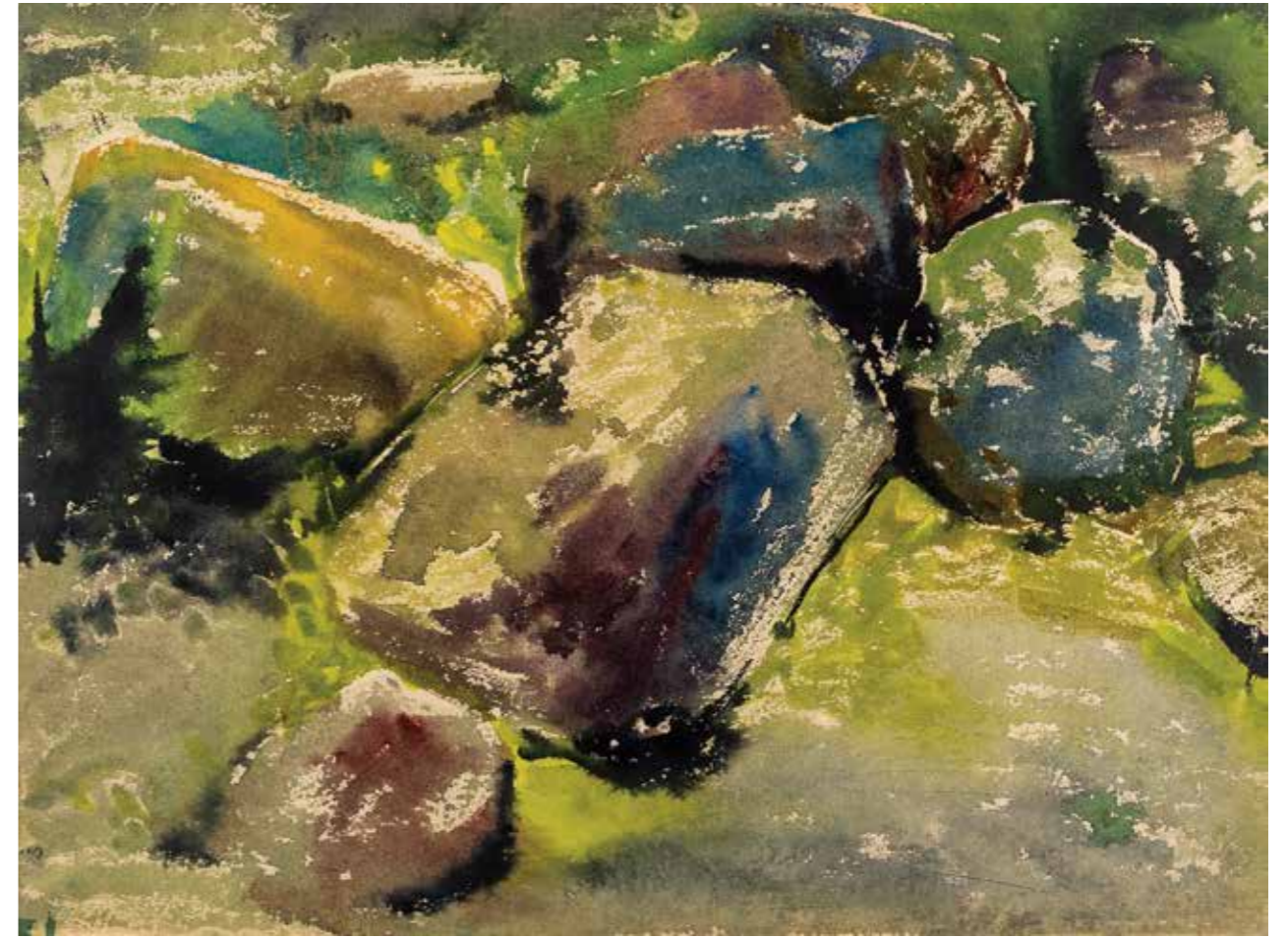
52 | Серія «Карпати», 1965 р. Папір, акварель. 31,5×35,5 "Carpathians" series, 1965. Paper, watercolor