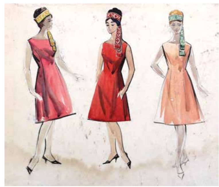
214 | Стрічки на волосся. Ескіз. 1960-ті рр. Headbands. Sketch. 1960s