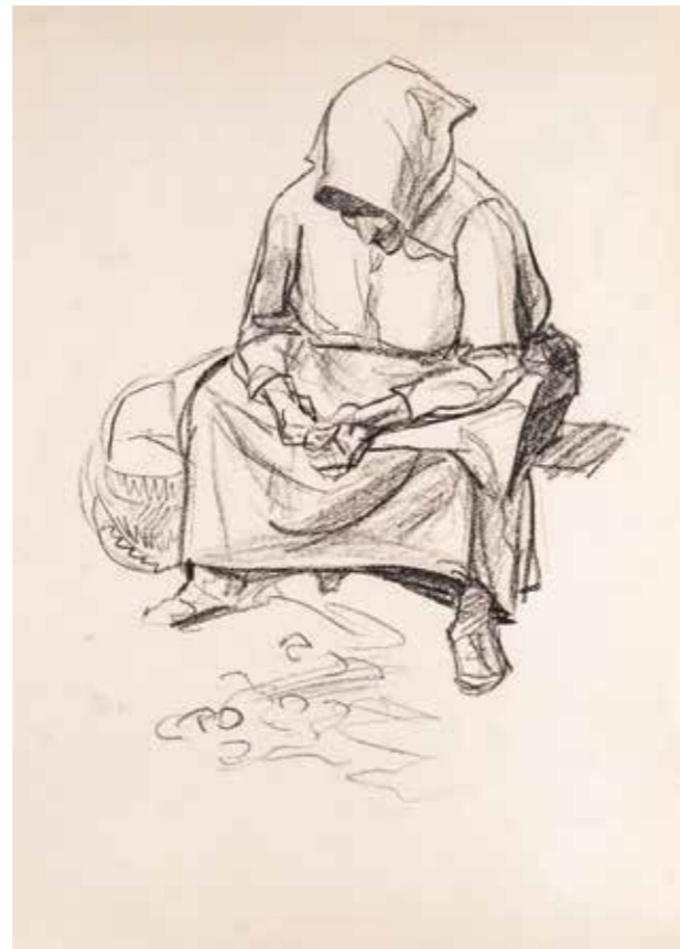
Натурниця, 1967 р. Папір, олівець. 59,5×42 | 11 Model, 1967. Paper, pencil