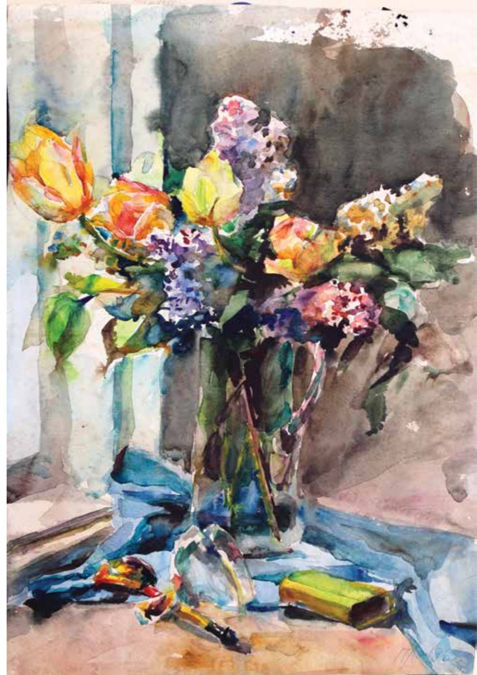
1 | Натюрморт, 1962 р. Папір, акварель. 52,5х37 Still life, 1962. Paper, watercolor