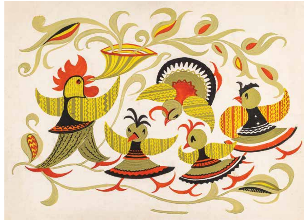
149 | Декоративний розпис, 1964 р. Папір, гуаш. 40×53,5 Decorative painting, 1964. Paper, gouache