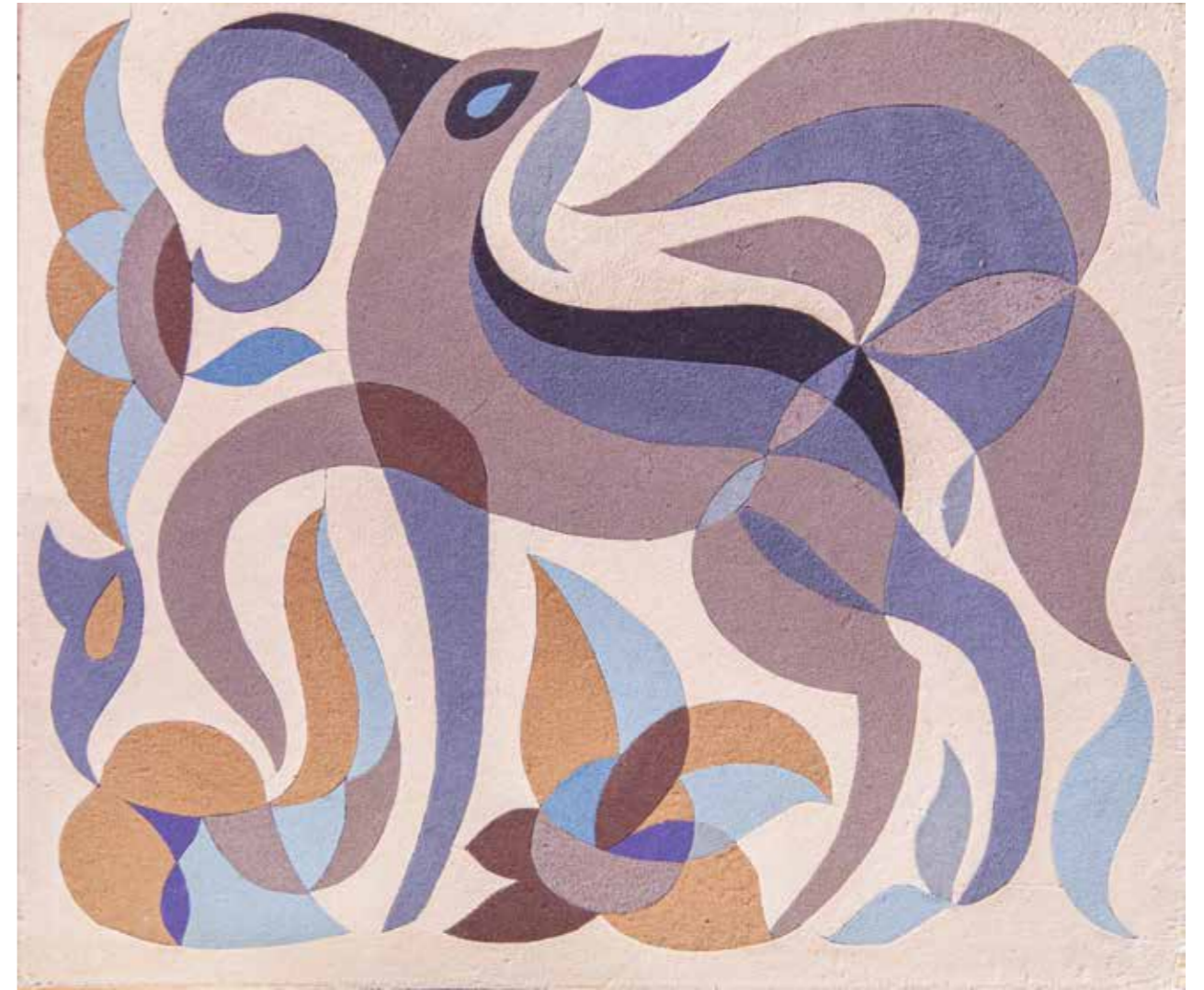
127 | На перші гулі, 1973 р. Колаж. ДВП, пальтові тканини. 67×78 To the first festivities, 1973. Collage, fiberboard, coat fabric