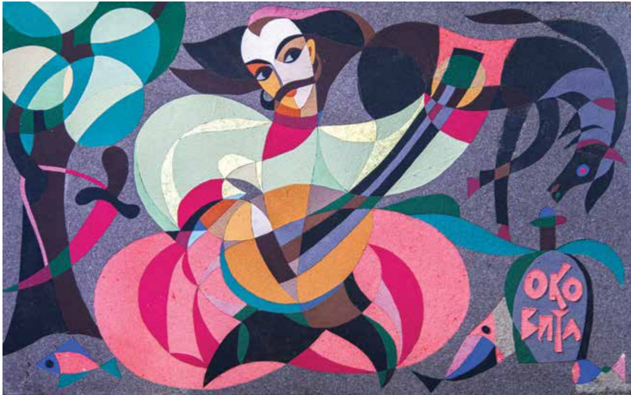
Козак Мамай, 1973 р. Колаж. ДВП, пальтові тканини. 88×140 | 126 Cossack Mamay, 1973. Collage, fiberboard, coat fabric