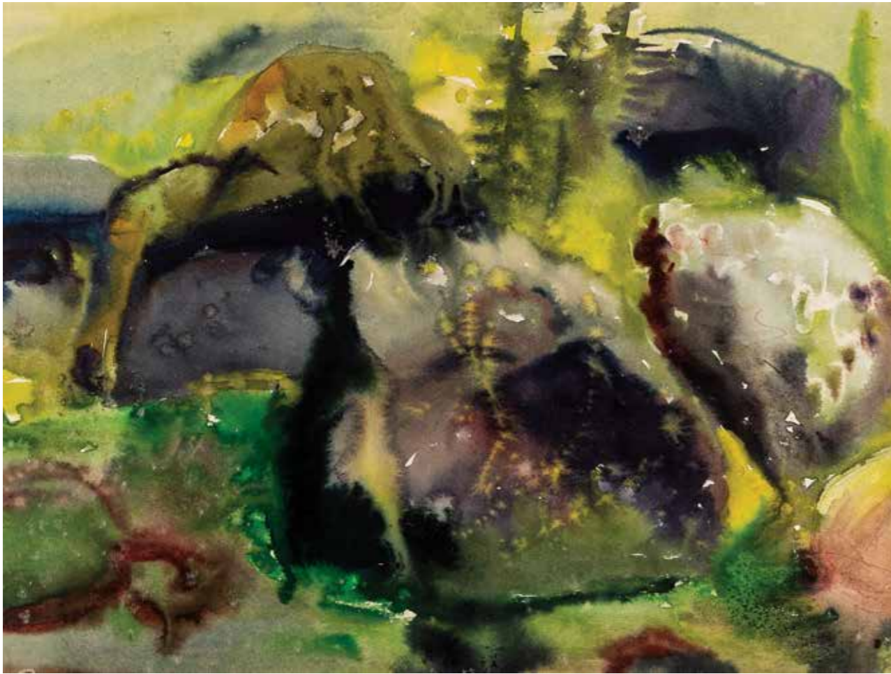
Серія «Карпати», 1965 р. Папір, акварель. 41,5×51,5 | 51 "Carpathians" series, 1965. Paper, watercolor