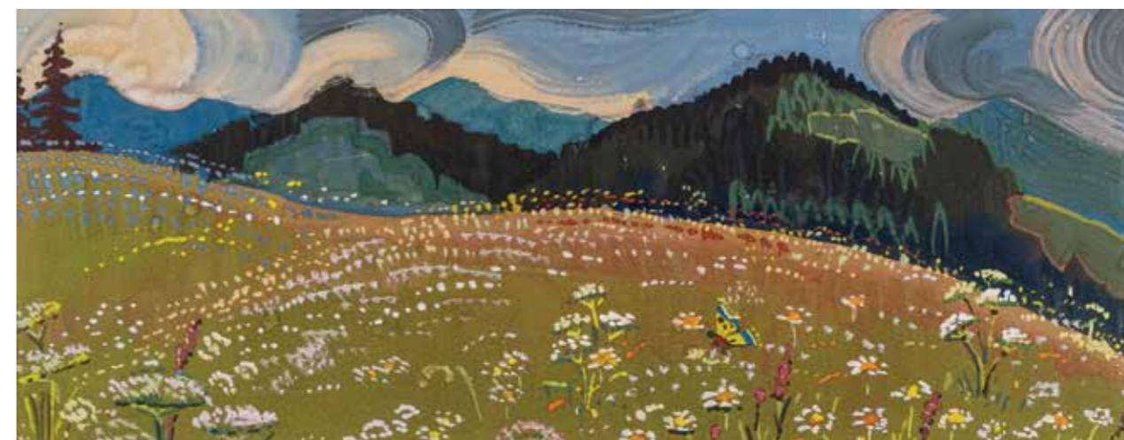
17 | Серія «Карпати», 1965 р. Папір, акварель. 27×49 "Carpathians" series, 1965. Paper, watercolor