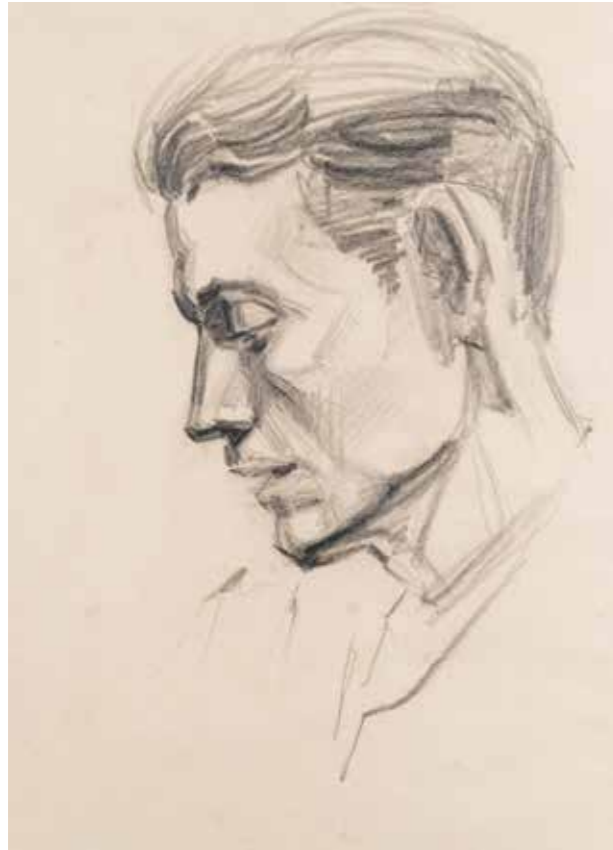
10 | Портрет невідомого. Папір, олівець. 53,5×41 Portrait of a stranger. Paper, pencil