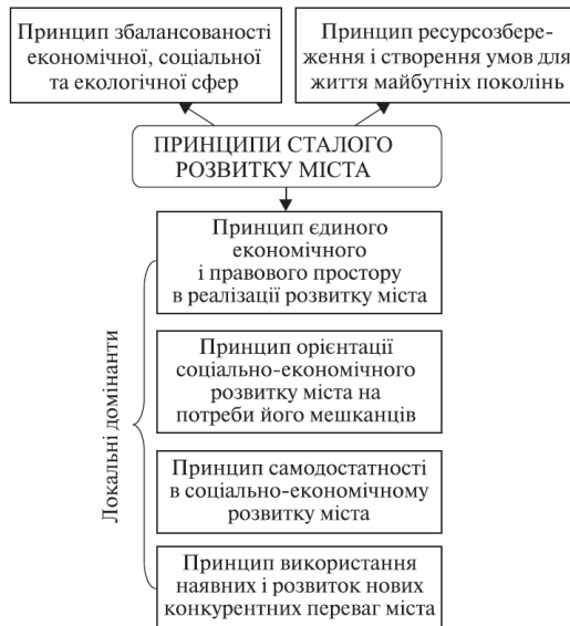
Рис. 1.3. Принципи сталого розвитку міста [4]

боротьбі за інвестиції та за робочу силу. Принципи сталого розвитку міста запропоновані О. А. Карловою представлені на рис. 1.3 [4].